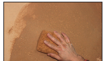
Schritt 4 - Sobald der Verputz vollständig getrocknet ist, wird die Oberfläche mit Hilfe eines leicht befeuchteten Schwamms geglättet, um den Oberflächenstaub zu entfernen und den Lein an die Oberfläche zu bringen.

Hinweis : Die Firma ARGILUS steht Ihnen für weitere Informationen zu den üblichen Öffnungszeiten unter folgender Rufnummer zur Verfügung : 0033 (0) 2 51 34 93 28.