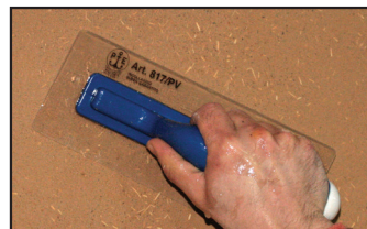
Schritt 3 - Nach Ablauf der Hälfte der Trockenzeit wird der Verputz mit Hilfe einer flexiblen Kunststoff-pachtel verdichtet.