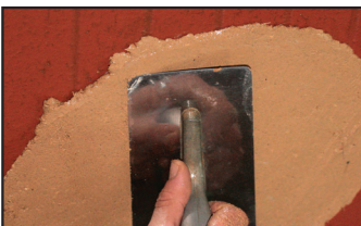
Schritt 1 - Direktes Auftragen auf einer leicht angefeuchteten Gipsplatte (keine Unterschicht oder untere Haftschrift)